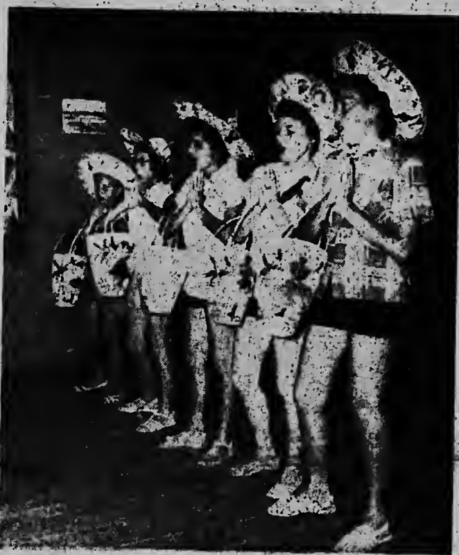
Vijf meisjes strandkleding demonstrerend op de kindermodeshow te Paradera.

Oorspronkelijk was het de bedoeling, dat de "Santa Rosa" Aruba alleen maar in het zomervacantie seizoen, d.i. van Mei tot September, Aruba zou aandoen om passagiers op te nemen. Deze drie aankomsten zijn ten onverwachte meevaller en vooral het feit, dat de "Santa Rosa" Aruba ook in de winter zal bezoeken is voor ons eiland een voordelige factor.